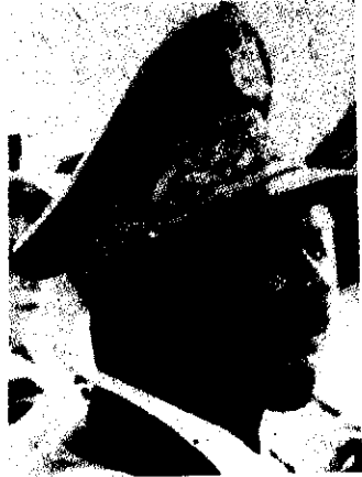
ጀን ቤዴል ቦካሳ

ቦካሳ አጭር ናቸው = ሚሊዮን ት/ቤት ተማሩ = በ1939 ለፈረንሳይ ጦር ሠራዊት ተመልሞለው በሁለተኛው የዓለም ጦርነት ተዋግተዋል = አገራቸው ነፃ ስትወጣ የጦሩ ኤታማዦር ሹም ሆኑ = አገራቸው ቦጋንጋ የፕሬዚዳንትነቱን ሥልጣን ያዙ = ከአምስት ዓመት በኋላ ፕሬዚዳንቱ በአውሮፕላን አደጋ ሲሞቱ የቦካሳ የአገራት ልጅ ዴቪድ ዳኮ የፕሬዚዳንትነቱን ቦታ ወሰዱ = በ1966 ቦካሳ የአገራቸውን ልጅ ገልብጠው አመራሩን ጨበጡ = የገለበጧቸውን የአገራቸውን ልጅ ለጥቂት ጊዜ በአሥር ቤት ካቆዩ በኋላ መክረውና አስመክረው በመፍታት አማካሪያቸው አደረጉቸው።