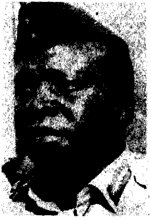
አዲ አሚን ዳዳ

ኡጋንዳውያን ይህን መዐት አሚኒዝም ብለው ሰየሙት ። በ1979 አሚኒዝም ሲያበቃ 300,000 የኡጋንዳ ዜጎች ተገድለዋል ። ተግባሩ የካምቦዲያው ፖለቲካ ያደረገው ዓይነት ነው ። በዚህ ሂደት ሞት እየተለመደ ስለሄደ ኡጋንዳውያን በድርጊቱ መሳቀቅ አቁመው ሞትን እንዴት አምልጠው በሕይወት ለመኖር እንደሚችሉ ብቻ ነበር የተማሩት ። በኡጋንዳ የሚኖር አንድ ባለግርሰሪ እንደነገረኝ “ወንድምህ በፖሊሶች ተወሰደ ከተባለ እንዳለቀለትና እንደማይመለስ ታውቃለህ ፤ ያላዘፍል ብለህ ለጥቂት ቀናት ታዝንና ሥራህን ትቀጥላለህ” በማለት አሜውተኝ ። አንድ አውሬ የሆነ ሰው እንደ ድመት እየተጫወተ ፤ እንደ አንበሳ እየተቅለሰለሰ አሥራ ሶስት ሚሊዮን ሕዝብ የሚኖርባትን አገር ገደላት ።