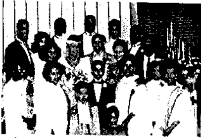
ፍትህ ስታገባ ከሴተሰባ ጋር