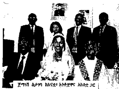
ጀግን ስታገባ ከአድታ አባታዎች ለክብር ጋር