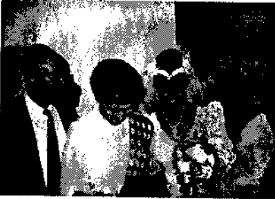
ፊት ስታገባ ከአገትዋ ለና ከአኔ ጋር