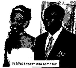
ገና ለቤብር ስታገባ ጋር ለሰጠ ለአድ