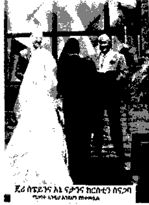
ጊደምንና እኔ የቃንና ክርስቲያን ሰናጋባ የጋብቻውን ስነስርዓት