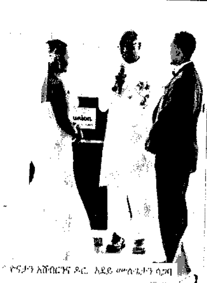
የፍታን አባባርዎች ዶ.ር. አይደሉም ለገና ጋር