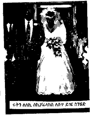
ሩትን ለለኪ ስኪቮሬላክለ ልሳት ደገፍ ሰንደ