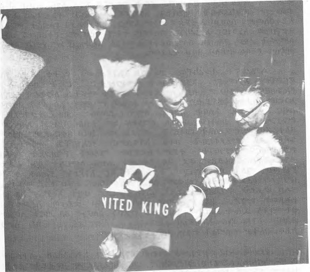
የታላቋ ብሪታንያ እና የአሜሪካ መልዕክተኞች ኧርነስት ቤቨንና ፎስተር ደለስ፣ በኤርትራ ጉዳይ ስለሚወስዱት እርምጃ ሲወያዩ።