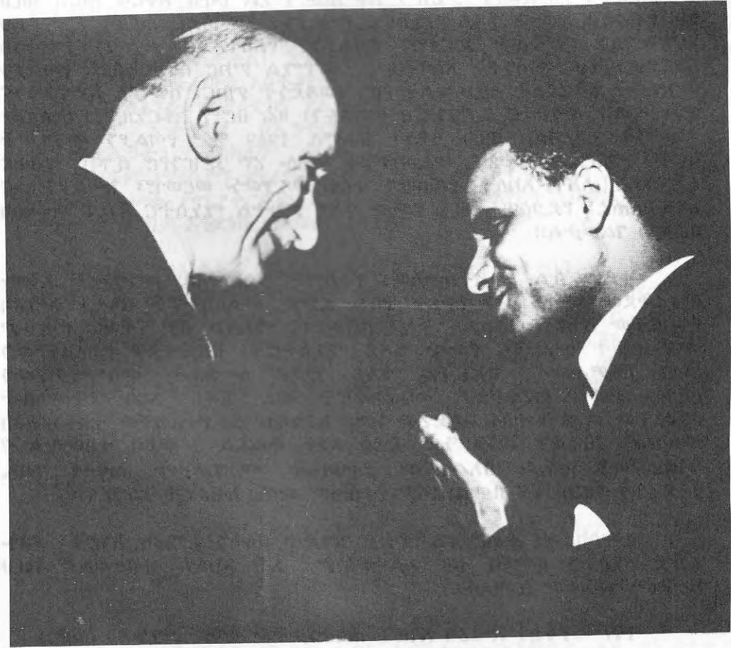
የኢትዮጵያና የፈረንሳይ የውጭ ጉዳይ ሚኒስትሮች አክሊሉ ሀብተወልድና ሮበርት ሹማን፡