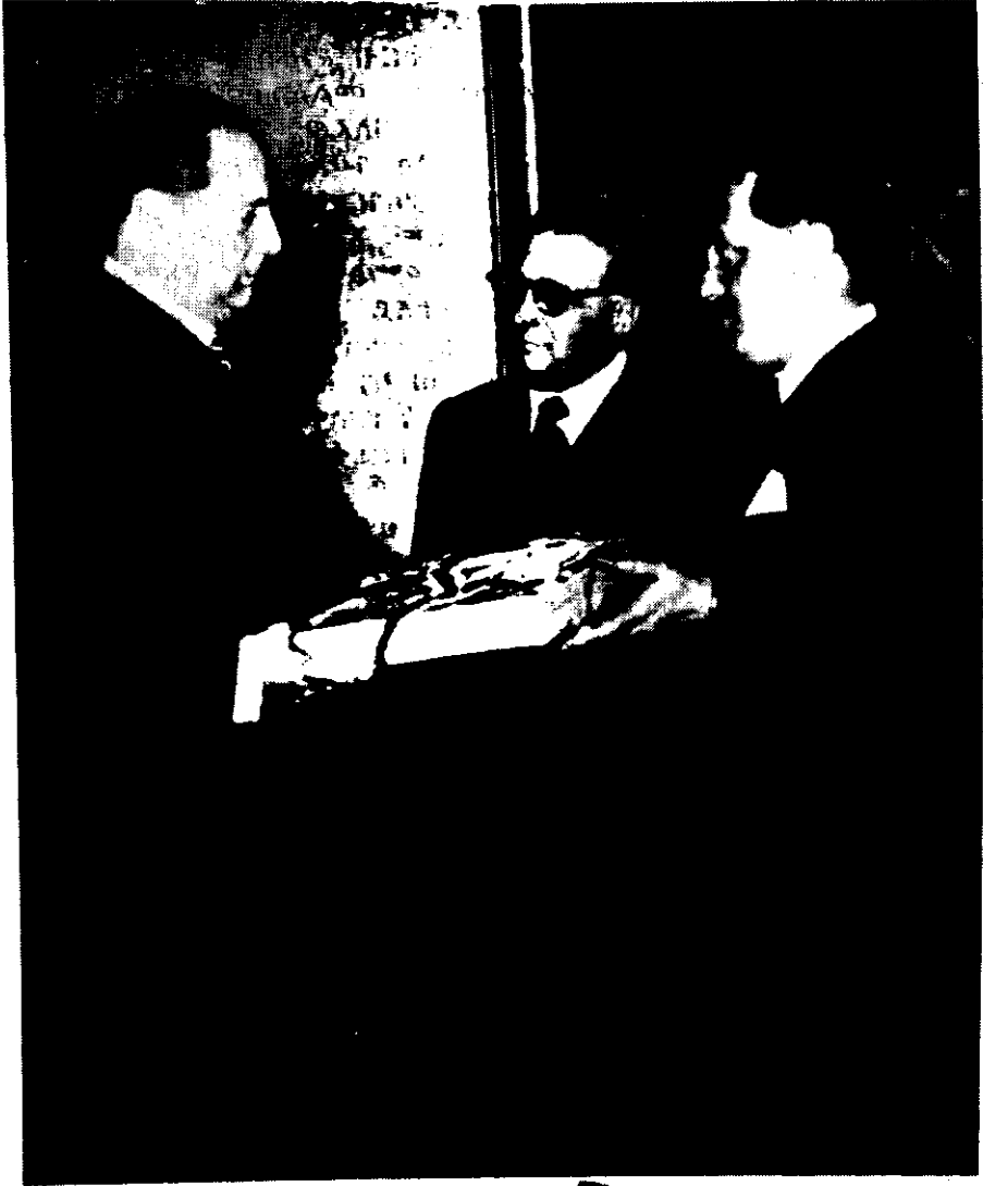
እነ ጁሴፔ ብሩዛስካ የጣሊያን የቦጉ ፈቃድ መልዕክተኞች፣ ለላቲን አሜሪካ መሪዎች ገጸ በረከት ሲያቀርቡ