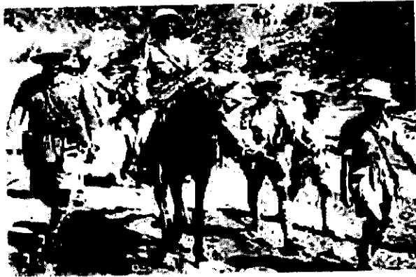
የንጉሥ ነገሥቱ ጉዞ ከማይጨው ወደ አዲስ አበባ።

ምክንያት የውስጥና ብቻ ሳይሆን፣ በልጅ ኢያሱ አምቀምቀት የተነሳ ሕዝባዊ ስሜትም ነበረበት።