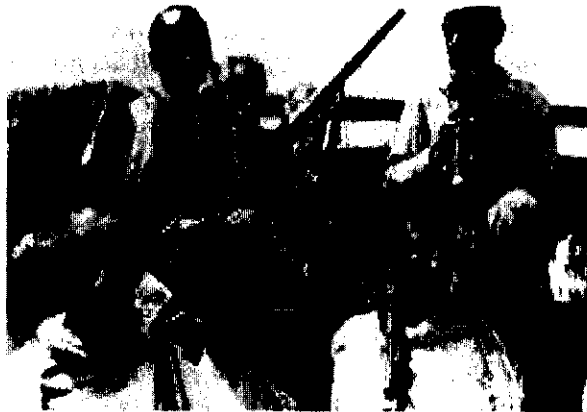
ከደቡብ ግንባር የአራሲና የባሌው ክፍተኛ መስዋእትነት የተከፈለበት ነበር።