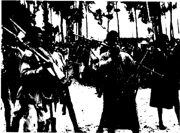
የኢትዮጵያ ሀዝብ በየአካባቢው ለአይተራው ጦርነት ከተት ጀመረ።

አስፈላጊውን ማድረግ አለበት። ነገሩ አልጣመውም። ቢሆንም ጉዞውን ቀጠለ። 5