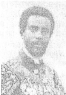
ጀግናው ራስ እምሩ ኃይለሥላሴ