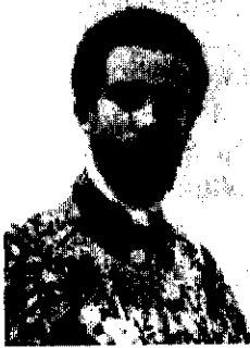
ጃግናው ራስ እምሩ ኃይለሥላሴ