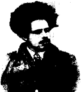
የአርበኞች አውራ ራስ አበበ አረጋይ።

የሹመቱ አሰጣጥ ደግሞ የራሱ የሆነ ችግር ነበረበት። የአርበኝነቱ ሥራ የሚንቀሳቀሰው ሀገር ወዳድ በሆኑ ተራ ሰዎች ነበር። ብዙዎቹ ጀግኖች ከሥራቸው በስተቀር የሚመኩበት የዘር ሀረግ አልነበራቸውም። የሚከፈላቸው ደመወዝ፣ የሚሰጣቸው ድጋፍ አልነበረም። ጠመንጃዎቹ እንኳን ከጣልያን የማረኩአቸው እንጂ ከመንግሥት የተሰጡአቸው አልነበሩም። ሹመቱ ግን በዘር ሆነ። ምንም በተለይ በራስ አበበ ጀግንነትና ብልህነት ቅር የተሰኘ ባይኖር፣ ሠራዊቱ በሙሉ ልብ አልተደሰተም።