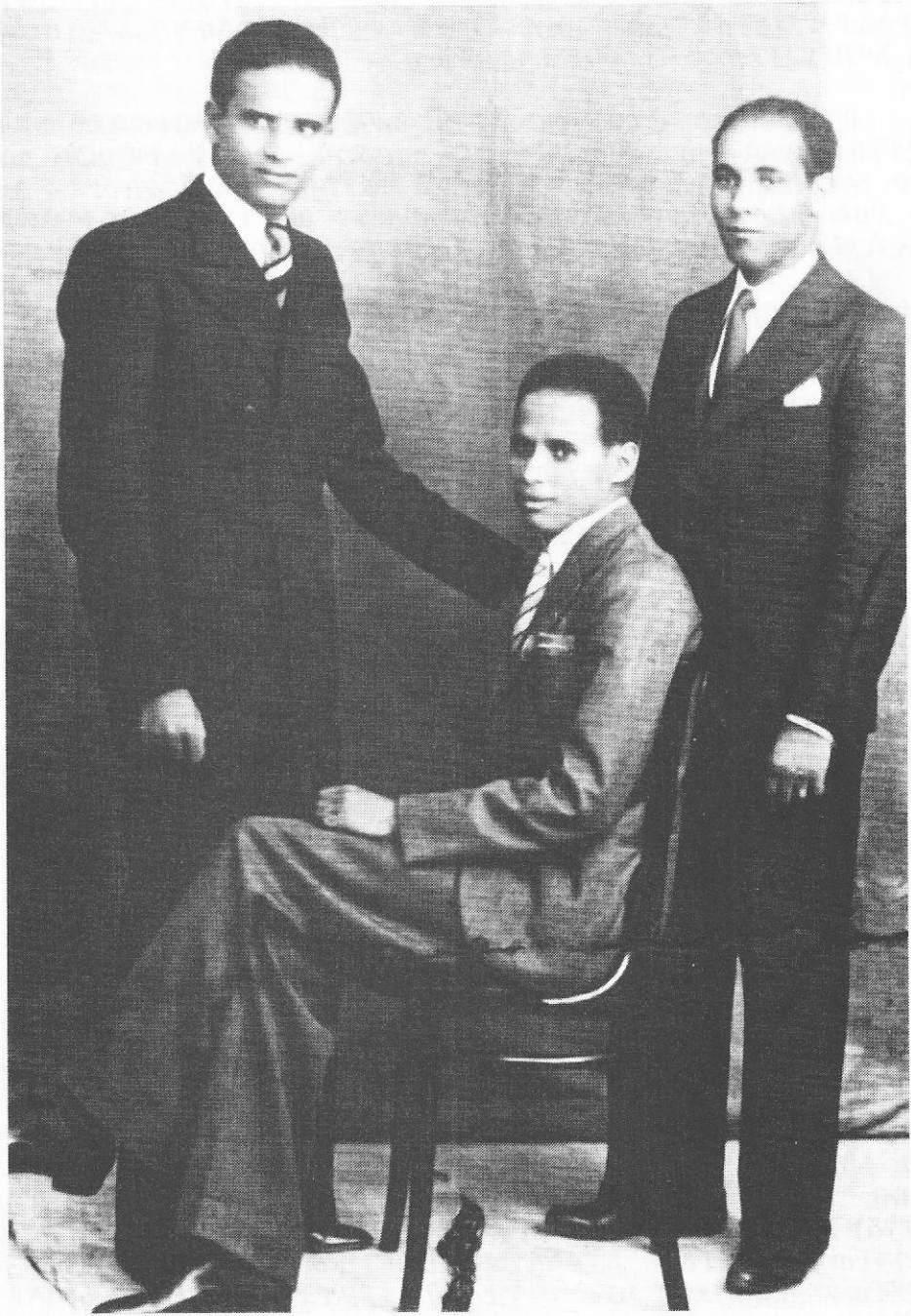
የሀብተወልድ ልጆች ለከፍተኛ ትምህርት ወደ ውጭ አገር ሲላኩ፤ ከግራ ወደ ቀኝ የቆሙት አክሊሉና መክብብ ሲሆኑ ወንበር የያዙት አካለወርቅ ናቸው።