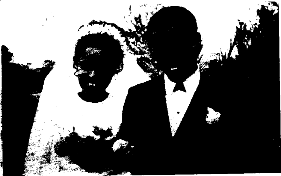
እኔና ጥበቡ በሠርጋችን ዕለት

መስከረም 10 ቀን 1968 ዓ.ም። ሙሽራው ሊመጣ ደቂቃ ቀርቶል። ሠርጌን ልግድመቅ ለኔም ያላቸውን ፍቅርና ከብር በሚቸሉት ሁሉ ለመግለጽ የሚያማምሩ የክትና አዳዲስ