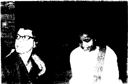
እንደ እናት የሆነችኝ ሚስት ፍላናጋን

ከአፍሪካ ከአውሮፓ ከእስያ ከአውስትራሊያና ከኒውዚላንድ ተውጣጥተው የመጡት እነዚያ ሁሉ ወጣት ተማሪዎች በመላው አሜሪካ ልዩ ልዩ ከተማዎች ወደ የተዘጋጁላቸው ቤተሰቦች በተቀላጠፈ ሁኔታ ተሰራጩ! እኔም እስካሁን ድረስ በደብዳቤና በላኩልኝ ፎቶ የማውቃቸውን አሜሪካውያን ቤተሰቦች ለመጀመሪያ ጊዜ በእካል ልገናኛቸው ጉዞዬን ጀመርኩ። ዓመቱን በሙሉ አብራያቸው እንደሆነ ቤታቸውን ከፍተው እጆቻቸውን ዘርግተው ይጠብቁኛል፤ የሚኖሩት ኒውዮርክ ግዛት ቡፋሎ ከተሰኘው ትልቅ ከተማ አጠገብ ከምትገኝ ኦርቻርድ ፓርክ ከምትባል ትንሽ ከተማ ውስጥ ነበር። የተሳፈርኩበት ግራይ ሀውንድ የሚባለው ትልቅና ዘመናዊ አውቶቡስ ከዝናኛው ኒውዮርክ ከተማ ተነስቶ የመጨረሻ መድረሻ ጣቢያው ቡፋሎ ከተማ ነበር። የሚቀበሉኝ አሜሪካውያን ቤተሰቦቼም በጉጉት የሚጠብቁኝ በዚህ ከተማ ስለነበር ጎዞዬን ወደ ቡፋሎ ቀጠልኩ። ከተሳፈሩት ተጓዥኞች መኻል አንድ አካባቢም ባይሆን እንደኔው ኒውዮርክ ግዛት ውስጥ የደረሳቸው ጥቂት ወጣቶች ነበሩ። አውቶቡሱ ጎራ በሚልባቸው ልዩ ልዩ ከተማዎች ሲደርሱ ተሰነባበትን። ረዥሙን ቀሪ ጉዞዬን የአገሪቱን ልምላሜ ንፅህናና ስልጣኔ እያደነቅሁ ቀጠልኩ።