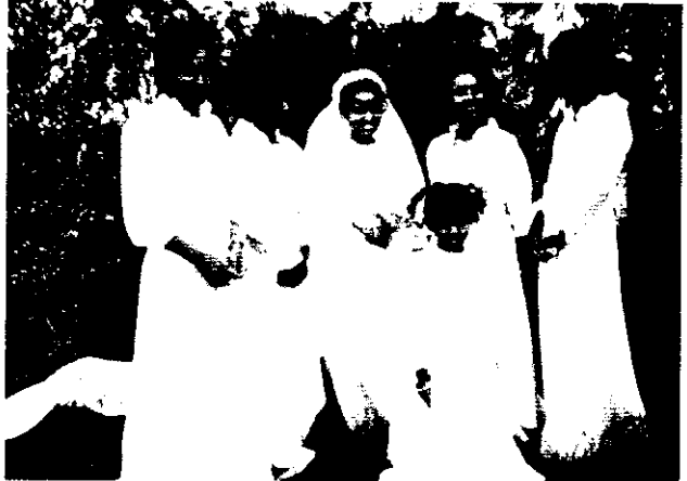
ከሴት ሚዜዎቹ ጋር