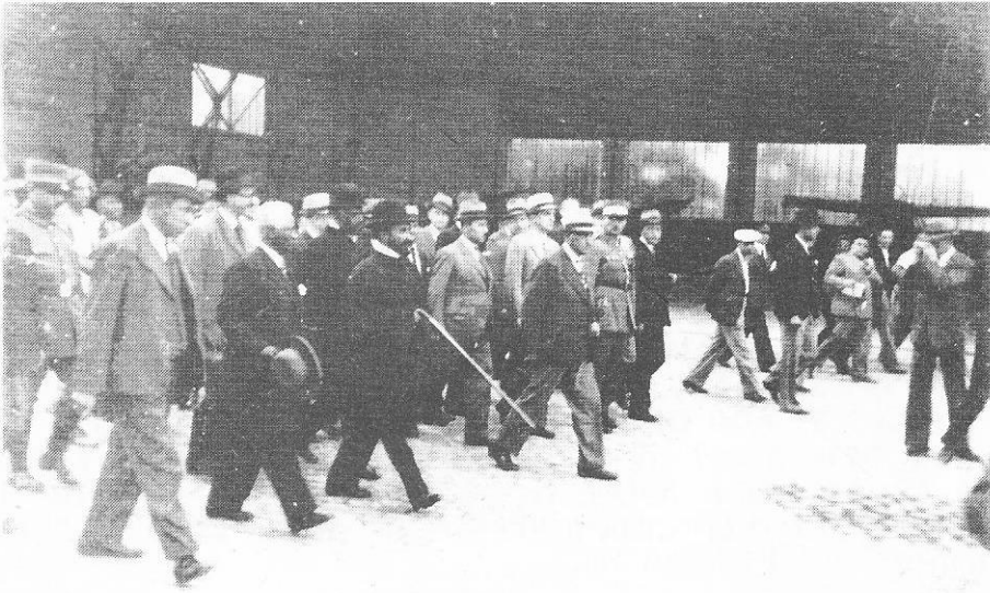
ቀ.ጌ.ሥ እና መልዕክተኞቻቸው ወደ ሊግ ኦፍ ኔሽን አዳራሽ ሲያመሩ፤ (June 30/36)