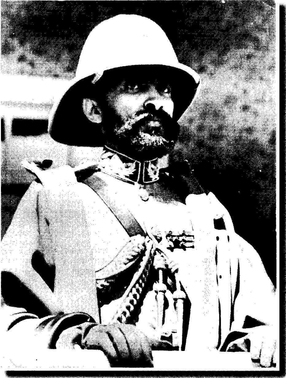
ቀዳማዊ ኃይለሥላሴ ጦር ሲያሰናቡቱ