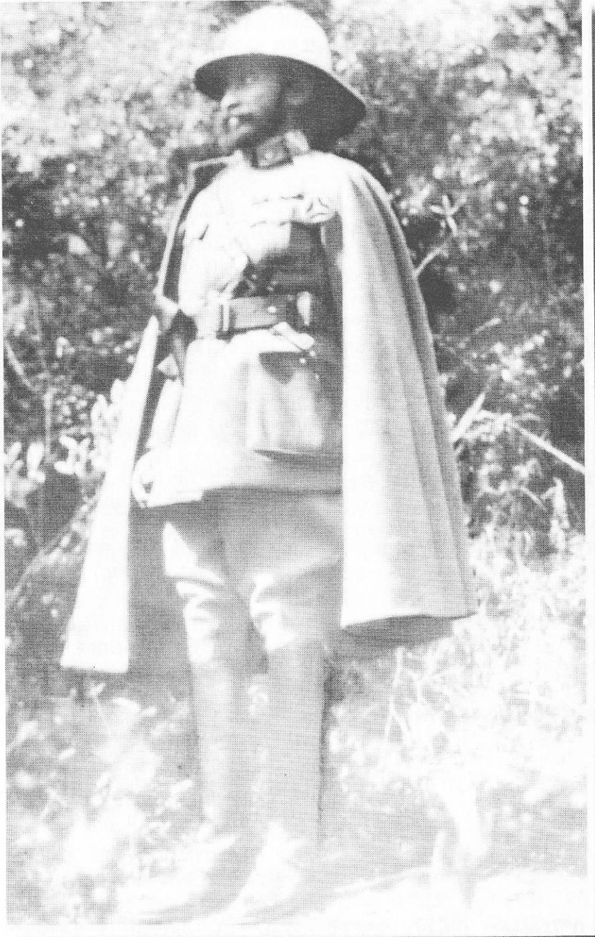
ንጉሠ ነገሥቱ በማይጨው ግንባር ላይ ሆነው