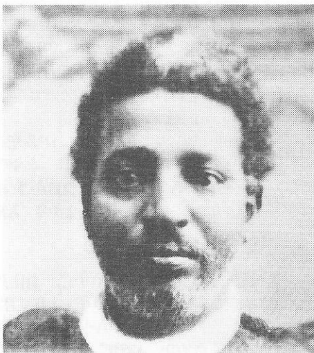
ክቡር ራስ ሙሉጌታ ይዘቱ፤ በአላጌ ግንባር ዋና አዛዥ