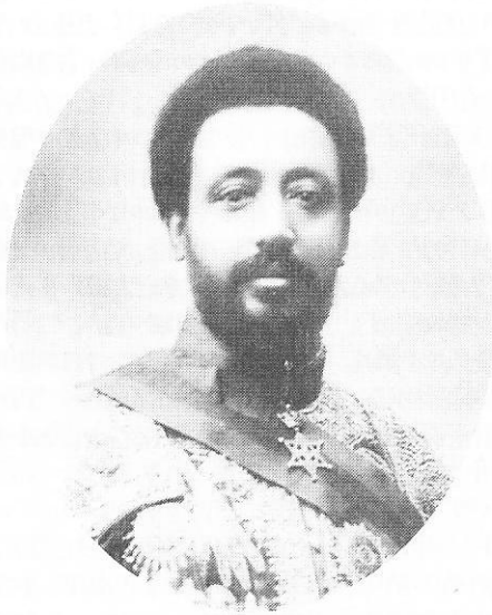
ክቡር ራስ ደስታ ዳምጠው ለግራ ደቡብ ዋና አዝማች፤