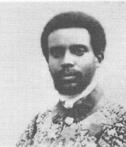
ክቡር ራስ እምሩ ኃይለሥላሴ፤ በሸፊ ግንባር ዋና አዛዥ