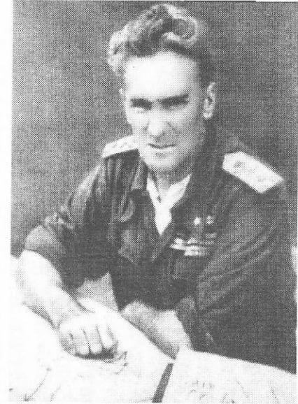
ማርሻል ሮዶልፎ ግራዚያኒ፤ (ሕዝባችንን በግፍና በጭካኔ ያስገደለ)