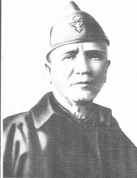
ማርሻል ፒየትሮ ባዶሊዮ፤ (ሕዝባችንን በጋዝና በመርዝ የጨረሰ)