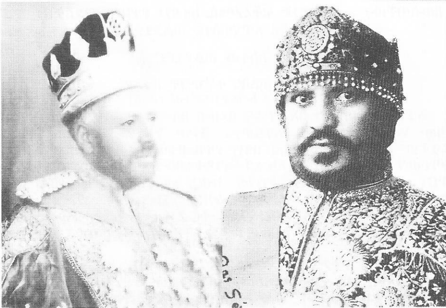
ልዑል ራስ ካሣ ኃይሉ አስተባባሪ ጠቅላይ አዛዥ