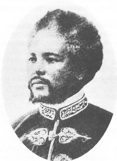
ክቡር ደጃዝማች በየነ መርዕድ ለማሕል ደቡብ ዋና አዝማች፤