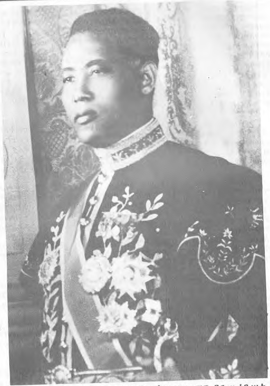
ቢትወደድ አንዳርጋቸው መሣይ በኢርትራ የግርማዊ ንጉሠ ነገሥቱ የመጀመሪያው እንደራሴ፤