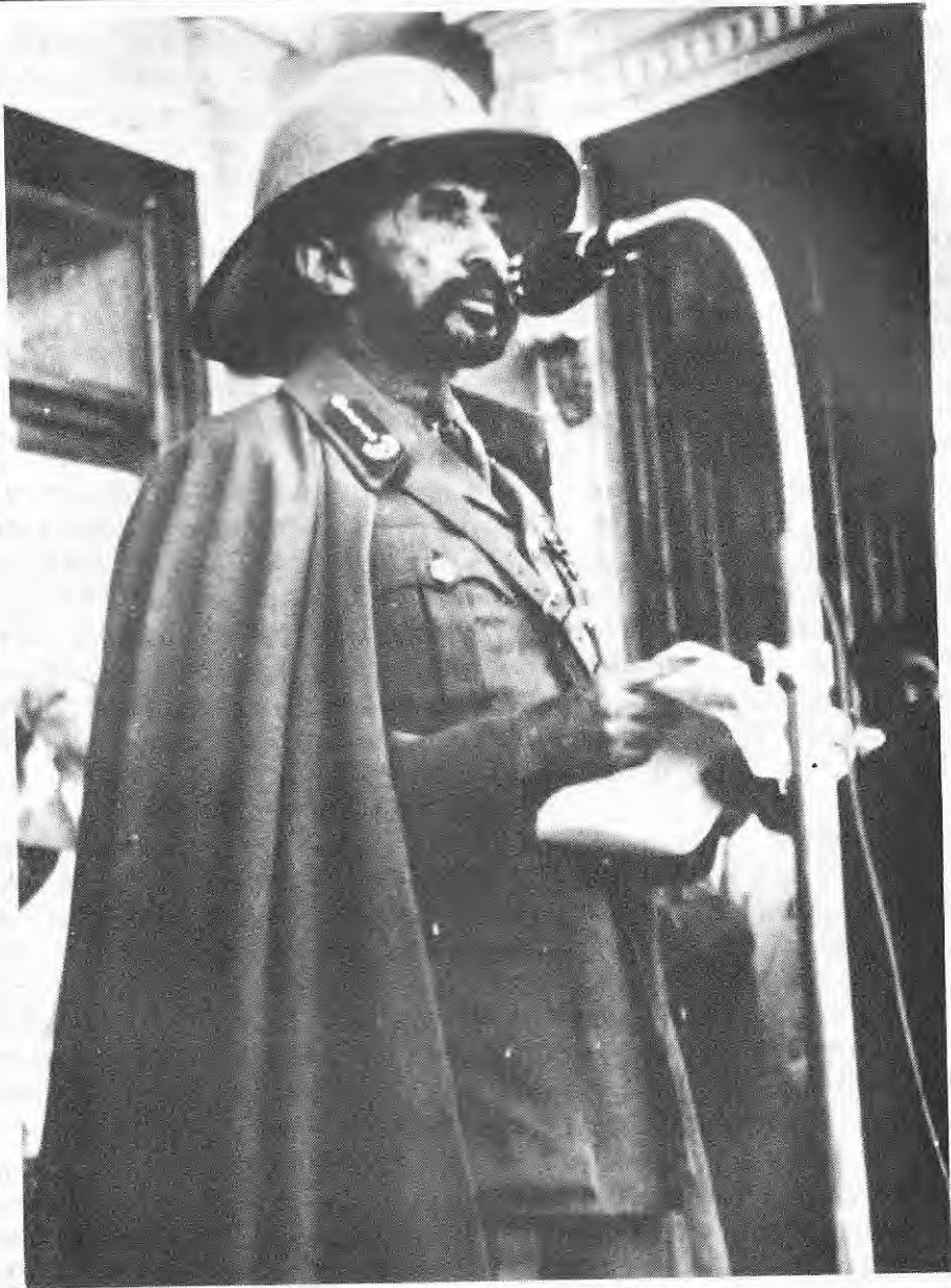
ንጉሠ ነገሥቱ አሥመራ ሲገቡ

« ..... ከአጼ ዮሐንስ ዘመን ወዲህ ገና ዛሬ ለመጀመሪያ ጊዜ፤ ንጉሠ ነገሥታችሁና ከፍተኛ ገዥዎችሁ፤ የኢትዮጵያና የኤርትራ ንጉሠ ነገሥት በመሆናችን በኤርትራ መሬት ላይ እንገኛለን። ..... »