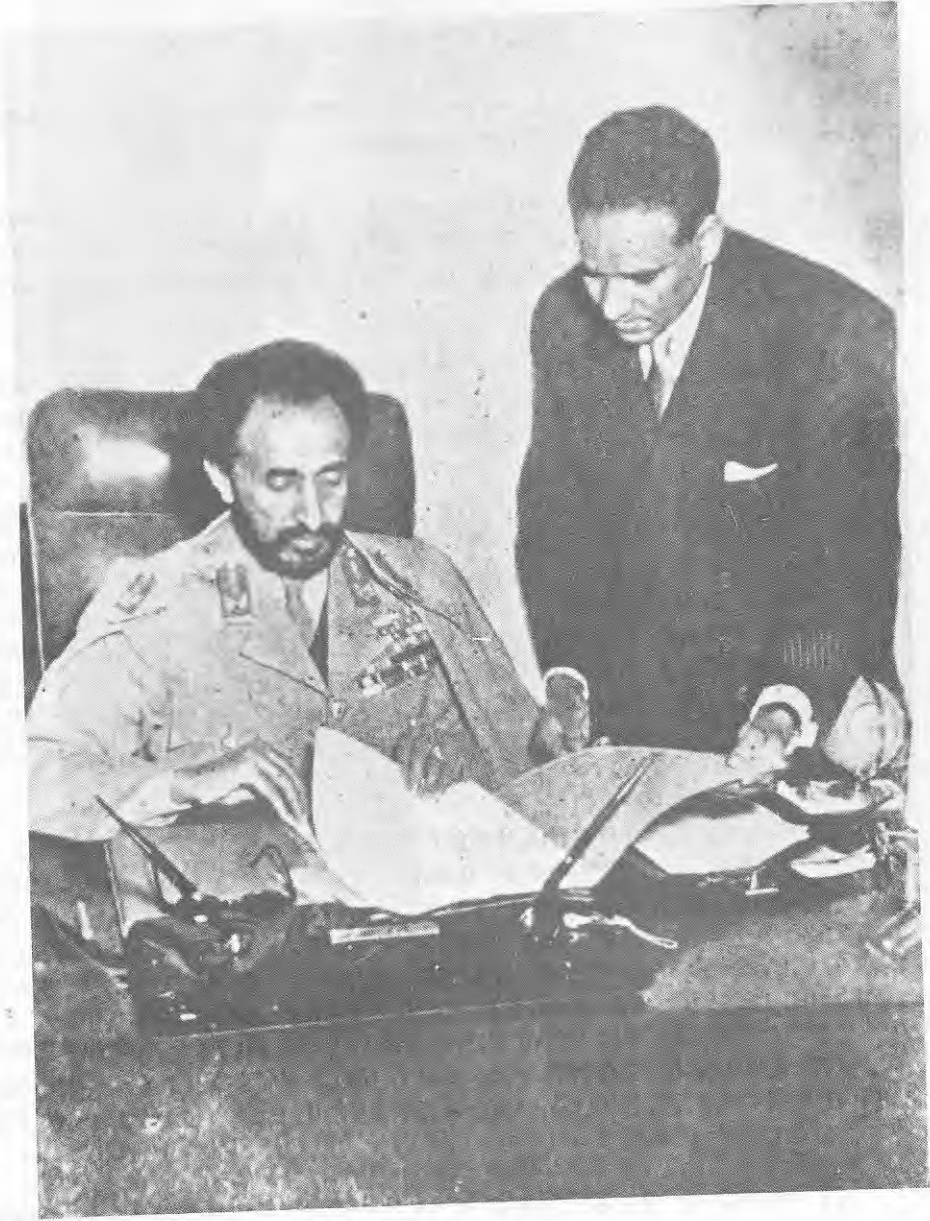
ቀዳማዊ ኃይለሥላሴ የኤርትራን ሕገ መንግሥት ሲያጸድቁ፤