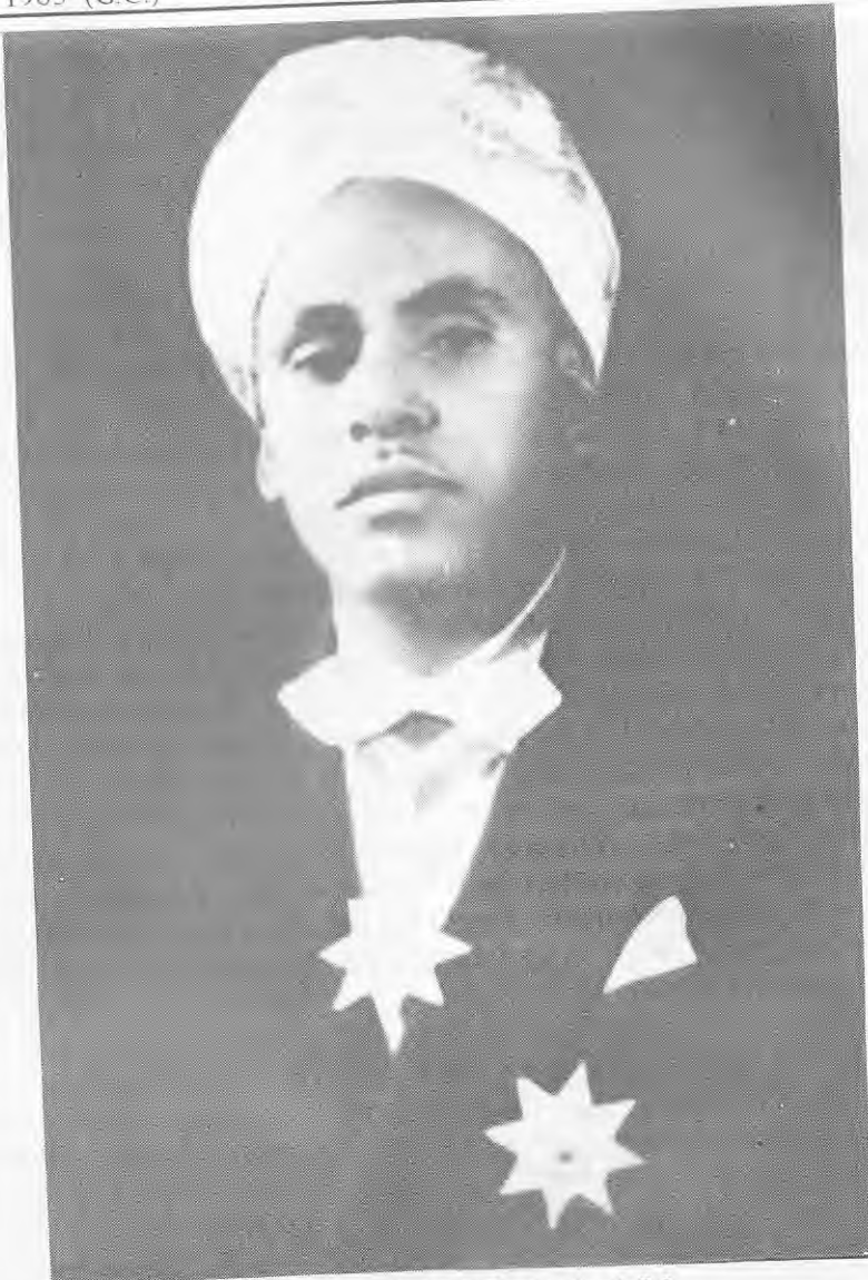
ሼህ ዓለ መሐመድ ሙሳ ራዳይ የኤርትራ ፓርላማ ፕሬዚዳንት