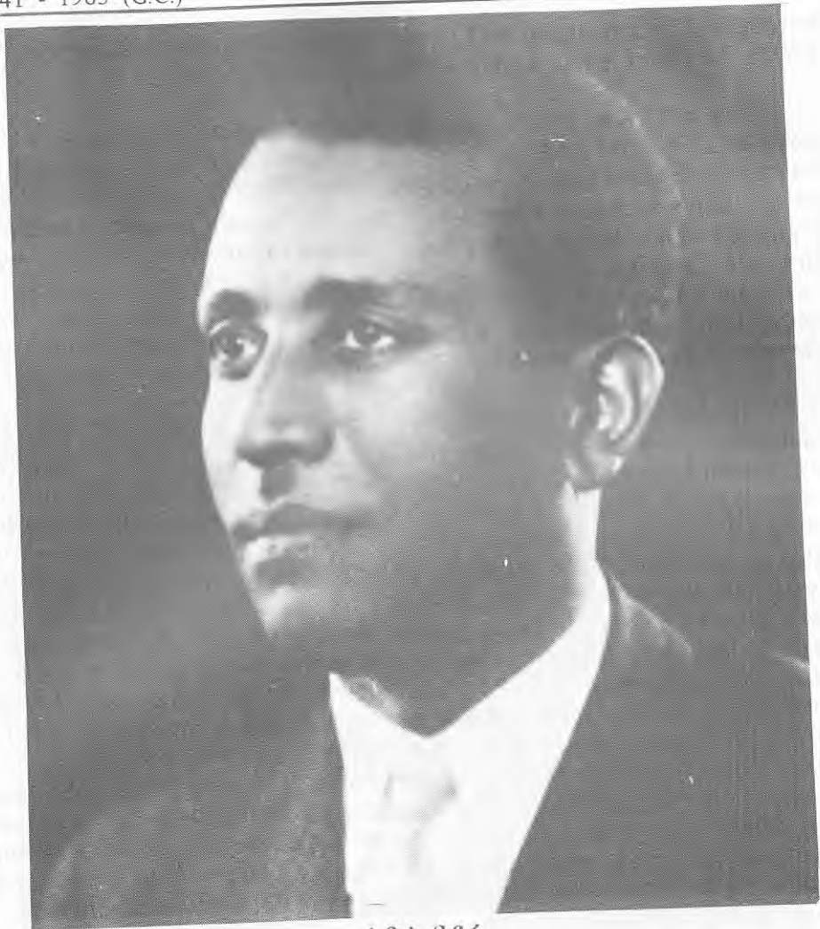
ተደላ ባይሩ የኤርትራ ቺፍ ኤግዜኩቲፍ