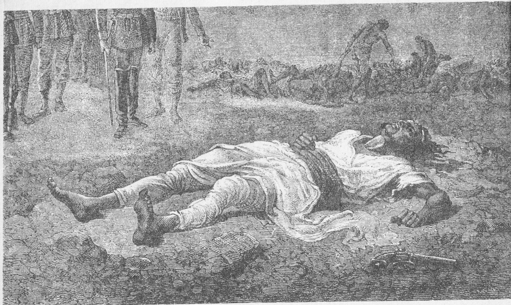
ዓፄ : ቴዎድሮስ : ራሳቸውን : በሽጉጥ : ገድለው : እንደወደቁ ።

የሚገባ : የክብር : አቀባበል : ተደረገለት : ይልቁንም : ከመቅደላ : ይዞት : የሂደው : የጥንት : መሣሪያና : በብራና : የተጻፉት : መጻሕፍት : ለሎንዶን : ቢብልዮቴክና : ለጥንታዊ : ዕቃ : ቤት : የሚጠቅሙ : በመሆናቸው : በጣም : ደስ : ተሰጥተው ። ስለዚህም : ጄኔራል : ናፒየርን : «ባሮን : አፍ : መቅደላ» : ብለው : ሠየሙት ።