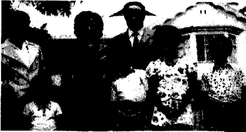
ናይሮቢ እንደገና መረጋጋት ሲታዩት ግቢ 1966 ዓ.ም.

የማሕበሩ አርማ ያለበት ቀለበት የሸሚዝ መያዣዎች ተሸልሜ ግደይም የእንገት ሃብል ተሸልማ ተሸኘን። የማህበሩም ሠራተኞች በአዲስ አበባ ምግብ ቤት አዳራሽ እራት ጋብዘውን ከላይ በጃርት ጠጉር ያጌጠ አግሩ የአጋዘን ቀንድ የሆነ ክብ ጠረጴዛ አበርክተውልን ሸኙን። ያ ጠረጴዛ አሁንም ጌጣ ጌጥ እያሰቀመጥን እንጠቀምበታለን።