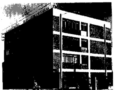
አዲሱ የመጽሐፍ ቅዱስ ማህበር ህንፃ ምረቃ