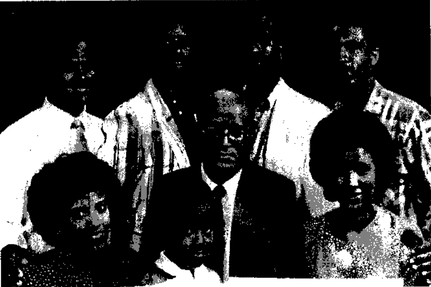
የኢትዮጵያ ፍቅራዊ ስነ-ምግባር ስራ ለካላም ሲቲ

የፈለጉ ደርግ አስመራን ለቆ ሲወጣ፣ ሻዕቢያ አስመራ አንደገባ ወደ አዚያው ሄደው ነበር፤ አዚያ አልቆዩም። የተመኙት አልተፈጸመላቸውም። ኢትዮጵያና ኤርትራ እንደ መልካም ነገራት አብረው ሊኖሩ ካለመቻላቸውም በላይ ጥለኞች ሆኑ። ሲሆን ሲሆን ሁለቱ አንድ አገር ሆነው አልያም አንደ አሜሪካና ካናዳ መልካም ነገራት ሆነው አንዲኖሩ ምኞት ነበረን። አንግዲህ ይህን መጽሃፍ አስከፍኩበት ለሳኩት ሰዓት ድረስ የተመኘነው ሳይሆን ቀርቷል።