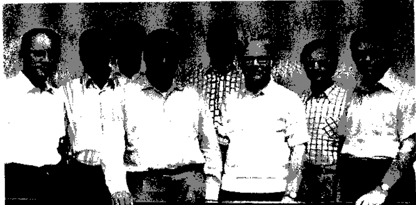
የሜኖናይት አለማቀፍ ኮንፍረንስ ሰራ አሰኪያጅ ኮሚቴ

ለሻይ ለንወጣ አንደገና የማዳን ወተውትኩት። "አንኚህ አውሮፓውያን ይህ ድርጅት አንደሌሎች የአውሮፓውያን አለመሆኑን በተግባር አንድንገልጽ ይፈልጋሉ፤ ስለዚህ መቀበል አለብህ" አልኩት፤ አሻፈረኝ አለ። ከሻይ መልስ የማዳን "ምን ትላለህ" ቢሉት "አልሆንም" አለ። ከዚያ በኋላ አንዱ መግለጫ ብጤ ሰጠና ሚሊዮን ፕሬዚደንት አንዲሆን ሃላብ አቀርባለሁ አለ። አኔም በበኩሌ "አኔ ዶክተር ዎልትነርን መተካት አልችልም፤ የማይመስል ነገር ነው፤ ለዚህ ብቁ አይደለሁም" አልኩ። አንዱ ሲመልስ "የማዳንን ምን ነበር ለትለው የነበረው? አንዴት አልችልም ትላለህ?" አለኝ። ሌሎችም ተመላላይ አስተያየቶች ሰጡ "ለየማዳ ያልከውን ምክር ፈጽሞ በማለት ገፋፋኝ" ላልወድ በግድ አሺ አልኩ። አንግዲህ የሚኛው ባላገር የሜኖናይት ዎርልድ ኮንፈረንስ ፕሬዚደንት ሆነ ማለትም አይደል! የኔታ ሥራ ይገርመኛል!