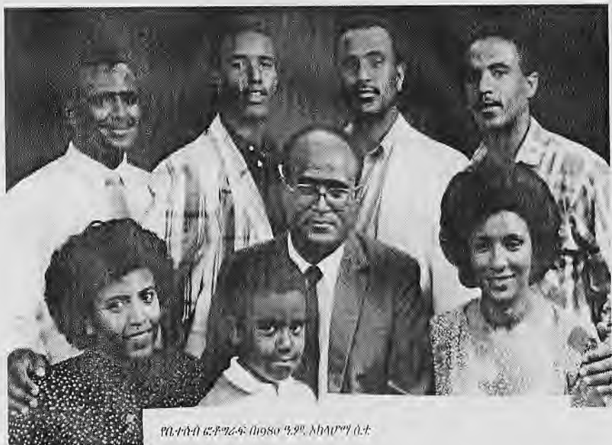
የቤተሰብ ፎቶግራፍ በ1980 ዓ.ም. እክላሊት ሲታይ