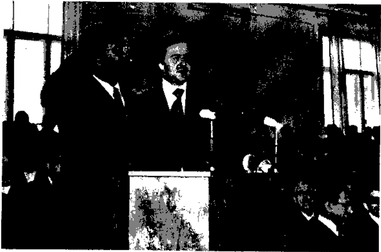
በዋናው ባፕቲስት ቤተክርስቲያን አዎቅ ቤሎ ለተቀመጠ ሀዘብ መልእክት ሳቀርብ