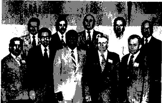
በዋቂታ (አሜሪካ) በተደረገው የሜኖርት አለማቆፍ ኮንፍረንስ ላይ የተገኙ መስተዳደራዊያን ጋር