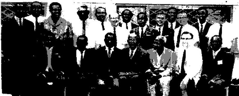
አንድወከላቸው ወደ ሜኖናይት አለማቀፍ ኮንፈረንስ የላኩኝ የአፍሪቃ ሜኖናይት እና ብራዘረን ኢን ኮራይስት ፌሎሞሺፕ

በዚያ ስብሰባ ላይ በአሰም ሜኖናይት ኮንፈረንስ ላይ አፍሪቃ እንድትወክል ጥያቄ ቀርቦ ስለ ነበር እኔ ተወክዬ በአምስተርዳም በሚደረገው ቀጣይ ስብሰባ አንድሄድ ተወሰነ። ያ ስብሰባ ከሁለት አመት በኋላ ስለሚደረገው የ1967 (አኤአ) አለም አቀፍ ስብሰባ ዝግጅት ለማድረግ ነበር። እዚያ ደግሞ የሥራ አመራር ኩሚቴ ማቋቋም ስለሰፈሰ ከአፍሪቃ የሜኖናይት ወርልድ ኮንፈረንስ ም/ፕሬዚዳንት የሚል ሹመት ሰጥተውኝ ማገልገል ጀመርኩ። አፍሪቃን መወከል ለእኔ ትልቅ ክብር ነበር።