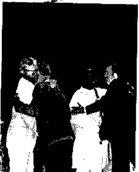
አሜሪካዊው መርኪን ሃይን እና ኢትዮጵያዊው ሚሊዮን በሜኖርት አለማቆፍ ኮንፍረንስ ላይ ለመገኘት የመጡትን ሩሲያውያን ለጉብኝ

እኔ ፕሬዚደንት ሆኜ ስሾም ለረጅም ጊዜ የማውቀው የቀድሞው የአኛ ሚስቶን በርድ ዋና ጸሐፊ የነበረው ፖል ከሬይቤል ለሜኖርት ዎርልድ ኮንፈረንስ ሥራ አስፈጻሚ ዋና ጸሐፊ (Executive Secretary) ሆኖ ተሾመ። ይህ ለእኔ ተጨማሪ ድፍረት ሰጠኝ። ፖል ግሩም ሥራ አቀነባባሪ ነበር። የስምንተኛውን ጉባኤም ሥራ አመራር ኮሚቴው በልዩ ልዩ ቦታዎች በመሰብሰብ አዘጋጅቶ ስምንተኛው የሜኖርት ዎርልድ ኮንፈረንስ ስብሰባ በአሜሪካ ዊቺታ ከተማ በሐምሌ ወር 1970 ዓ.ም ተደረገ። ያን ስብሰባ ከመራሁ በኋላ የሜኖርት ዎርልድ ኮንፈረንስ ተሰናበተሁ። በአፍሪቃው ድርጅታችን ላይ ግን ማገልገልን ቀጠልኩ። ይህንን ሁሉ የማገልገል እድልና ታላቅ ከብር ያገኘሁት በመሠረተ ከርስቶስ ቤተ ክርስቲያን በነበረኝ ተላትፎ ምክንያት ነው። ስለዚህ እግዚአብሔርን አመሰግናለሁ።