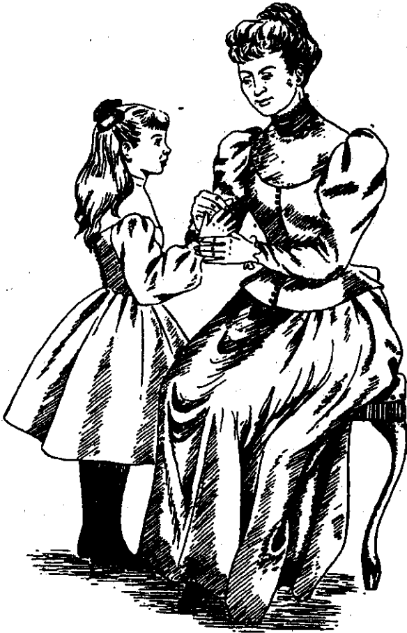
ሄለን ኪለር ከአስተማሪዋ ከአኔ ሱሊቫን ጋር

በመበላጩት ህሊናዋን እስከ መሳት ትደርሳለች። ይህን የመሰለው ሁኔታ በሚፈጠርበት ጊዜ በቁጣ በመወራጩት ያገኘችውን ሁሉ ስለምትወረውር እስኪበርድላት ድረስ ደፍሮ የሚጠጋት ሰው አልነበረም።