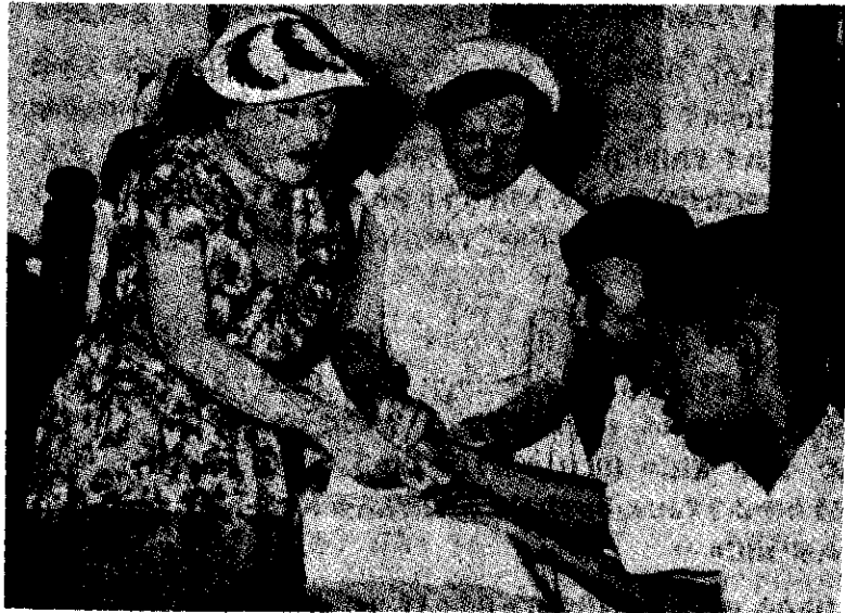
ሄለን ከአር በጉዞዎች ከጎበኛቸው አይነ ስውራን ተግራዎች ጋር

የሄለን የጃፓን ጉብኝት አይነ ስውራንን በሚያጠቃው የጭለማ ህይወት ላይ የሰነዘረችው የመጀመሪያው አለም አቀፍ ዘመቻ ነበር።