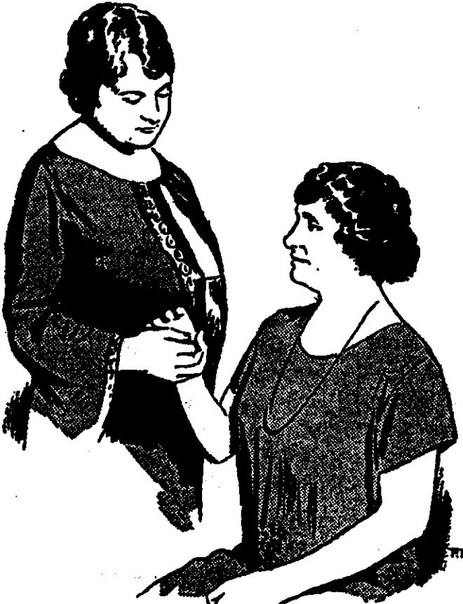
ሄለን ኪለርና አስተማሪዋ አኔ ሱሊቫን «በጣት ንግግር» ሐላብ ሲለዋወጡ።

ሄለን የዚህ አይነቱ ችግር በተደጋጋሚ ቢደርስባትም፣ ችግርን ከመጋፈጥ ወደ ኋላ የምትል አልነበረችም። በአካል ጉዳተኝነቷም ምክንያት ከማንም ጤናማ ሰው በላይ የህይወትን ትርጉም የተረዳችው ሄለን፣ «ህይወት በፈተናና በትግል የተሞላ ወይም ባዶና ደባሪ ነው። ምን ጊዜም ከሁለት አንዱን መሆን አለበት» ትላለች። ህይወት የሚባለውን ረቂቅ ነገር በሚገባ የተረዳችውና የራሷን ፍልስፍና መልክ ማስያዝ የቻለችው ሄለን፣ አንዴ በባቡር፣ አንዴ በአውቶቢስ፣ በሌላ ጊዜ ደግሞ በታክስ በመጓዝ በጨለማ ላይ የከፈተችውን ዘመቻ በድል ለመወጣት ትግልዋን ቀጠለች።