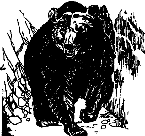
ዩድ 13+2 ድቤ ጋርዳክ ዴብ

ይንት ዘምነምኪ ይንት ባምነምክ፣ ገላሼንይ ጋንጫ ኪን እምሴ። 3 መ-ግርክተንኪሬ ዎለቅነ ዴይሰድንይ ከምድንይ አፕን ደይክ ሸጅ-ቲ፤ ዴእከን ግሣቃክ ዲድኔሬ ሀልሸተ ሃቄ።