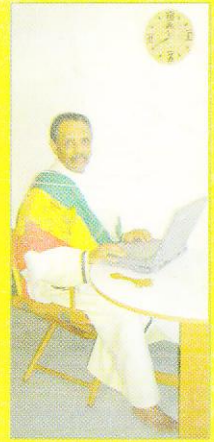
ገብረ እጅ አርጋዎን ስድስት ግድር ሲሆን