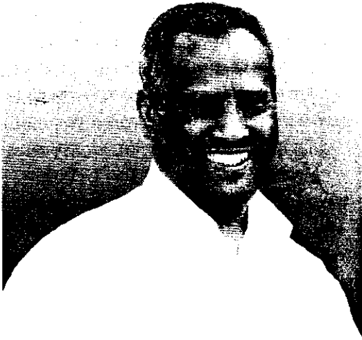
ጥበቡ ከመታመሙ ከሦስት ቀናት በፊት

እኔ የሐኪሙን ሪፖርት አስታኮ ልቤን ሊያርድ የሚፈልገውን የሞት ድምፅ በመንፈሴ እየተቃወምኩ የሰማሁትን ላለመሰማት ቆርጫ ተነሳሁ። በሕይወት ለመኖር ላለመኖር “ወሳኝ ይሆናሉ” ያላቸውን የሞት ጥላ ያጠላባቸውን ቀጣይ ቀናት በሕይወት እንዲያሻግርልን በጸሎት