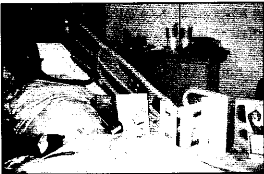
ጥበቡ ከአይሲዩ በወጣ በአራተኛ ቀኑ 60ኛ ዓመቱን ስናከብርለት

ስድስት ሰዓት ይፈጃል ተብሎ የተነገረንን ጊዜ በሁለት ሰዓት ብቻ አሳጥሮልን ጥበቡን በሕይወት ከዚያ አስጊ ኦፕሬሽንን አወጣልን። ግን ውጤት አልባ የሆነ ቀዶ-ጥገና ነበር፤ እግዚአብሔር የጥበቡን ሕይወት ጠበቀልን እንጂ። ሐኪሞቹ ሆዱን ከፍተው የጠረጠሩትን የቸገር (የአየር) ምንጭ ሊያገኙት አልቻሉም። ስለዚህም መልሰው ዘግተውታል።