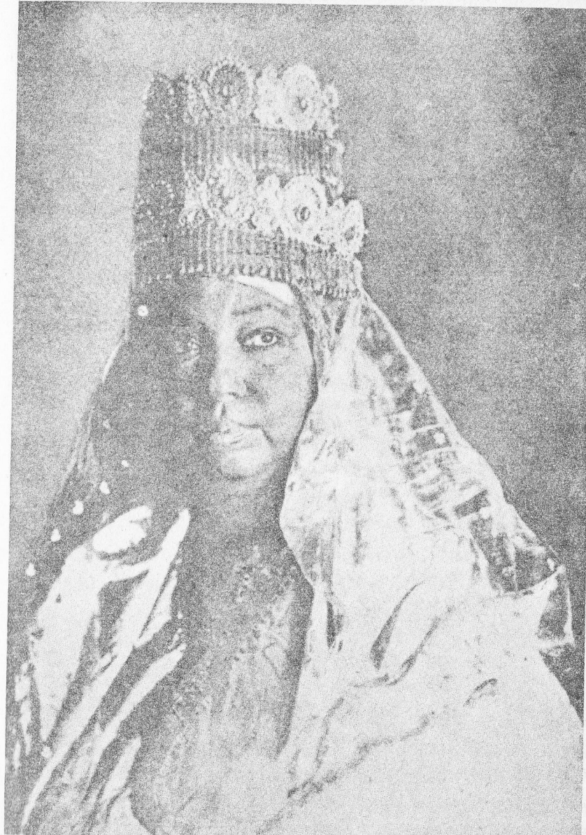
እቴጌ ፡ ጣይቱ ።

ዳግማዊ ፡ ምኒልክ ፡ በዚህ ፡ ከኢጣሊያኖች ፡ ባገኙት ፡ መሣሪያ ፡ ኢጣሊ ያኖችን ፡ አባረው ፡ የኢትዮጵያ ፡ ጠረፍ ፡ እስከ ፡ መረብ ፡ ድረስ ፡ መሆኑን ፡ ከጦርነቱ ፡ ወዲህ ፡ በስምምነት ፡ ከኢጣሊያ ፡ መንግሥት ፡ ከተዋዋሉ ፡ በኋላ ፡ ከዚያም ፡ በፊት ፡ ከኢትዮጵያ ፡ ደቡብ ፡ ያለውን ፡ ታላቁን ፡ የሐረርን ፡ ግዛት ፡ ራሳቸው ፡ ሄደው ፡ ባ፲፰፻፸፱ ፡ ዓመተ ፡ ምሕረት ፡ አሜር ፡ ዐብዱላሂን ፡ ወግ ተው ፡ አስመልሰው ፡ ነበር ። ወዲያው ፡ አሜር ፡ ዐብዱላሂ ፡ ተሸንፎ ፡ እጁን ፡ ሰለ ፡ ሰጠ ፡ አገሩን ፡ በቅንና ፡ በትክክለኛ ፡ ፍርድ ፡ እንዲያስተዳድሩ ፡ ራስ ፡ መኩንንን ፡ ደጃዝማች ፡ ብለው ፡ ሾመው ፡ ሐረር ፡ ትተዋቸው ፡ ተመልሰው ፡