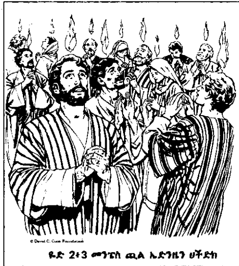
ዩድ 2+3 መንግስት ጫል ኤድንዜን ሀቅድክ

7 ገእሽ ሪርቶ ኮይን ገይሴኪ፡- «ዩኔቶ! ኪነ ኪዝዴድነ ሙደ ገለል ኤድ ደኪኮ? 8 ተ አነ ዎተ ዎለቅዎለቂድነ ዎአፔክ ኪ ኪዝድክ ኤሰርዶቴ፤ ኮይን ሀሰኖክ ማሚ? 9 ዎተ ጳርቴ ፕጭግርሚትኪ ሚድግርሚትክ፣ ኤላምግርሚትኪ